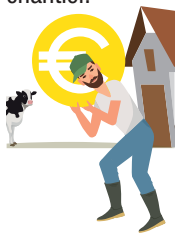
Illustration 1 : La pression financière : une source de charge mentale

40% des éleveurs ne sont pas, ou pas du tout, satisfaits de la pression financière induite par le projet. Viennent ensuite, le non-respect du budget et des délais sur le chantier.